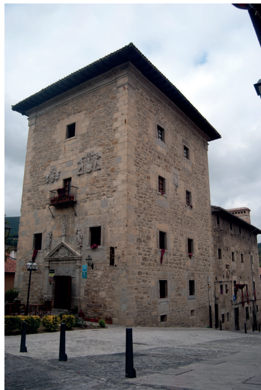
Torre de los Ortiz Molinillo de Velasco. Artziniega