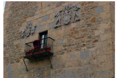
Escudos de la fachada de la Torre Ortiz Molinillo de Velasco. Artziniega