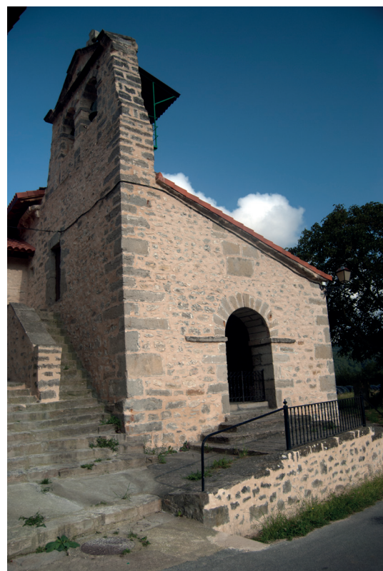
Iglesia de Añes