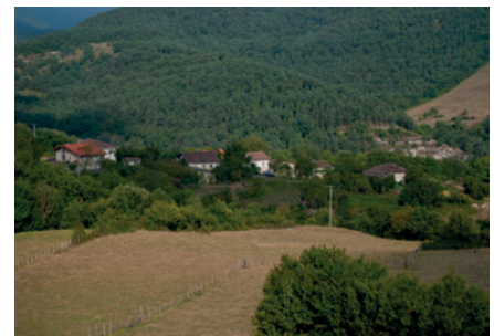
Soñes Geotech, S.L.